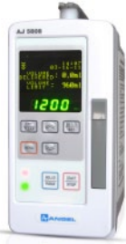
AJ5808 avec clavier simplifié