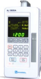
AJ5808A avec clavier numérique