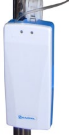
Réchauffeur de perfusion FW-300