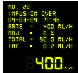
Affichage de l'historique des événements